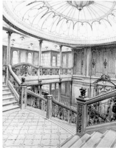
Legende zu Foto 4-5: Das Foto aus dem Katalog der Firma Welte von 1914 und entsprechende Zeichnungen unbekannter Herkunft zeigen das Treppenhauses der Britannic .

Die Firma Welte spricht von einer „ Welte-Philharmonie-Orgel an Bord eines grossen englischen Dampfers“ und nennt die Britannic nicht namentlich. Dies wohl deshalb, weil die Orgel im Spätsommer 1914 wieder ausgebaut und eingelagert werden musste und die Britannic nie als Passagierdampfer unterwegs war. Da die Britannic gesunken war, konnte die Orgel nach dem Krieg nicht wie geplant wieder eingebaut werden. Ihre Spur verliert sich. Sowohl von Seiten der Erbauer des Schiffes, Harland & Wolff im irischen Belfast, als auch von Seiten der Firma Welte sind keine Unterlagen zum Verbleib der Orgel aufzufinden.