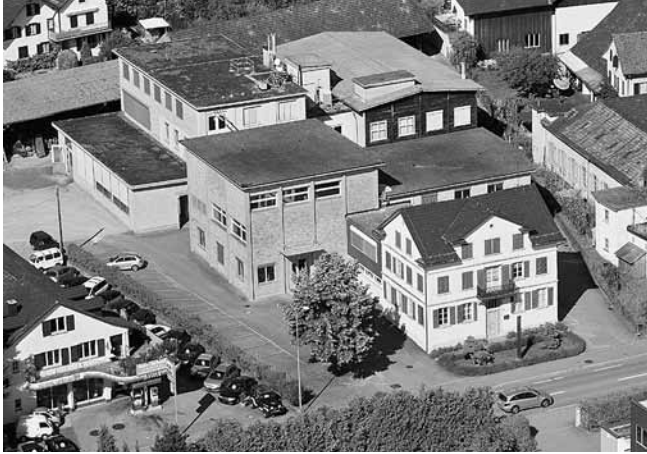
Luftaufnahme Betriebsareal 2008

Eine fortschrittliche Betriebsatzung sorgt für Transparenz, Mitsprache und Teilhabe der über 40-köpfigen Belegschaft. Der Teamgedanke zeigt sich auch im Lohnverhältnis von maximal 1:3 zwischen Lehrabgängern und der Führungsstufe. Dieses Gemeinschaftsgefühl übersetzt sich für Kunden in Kontinuität.